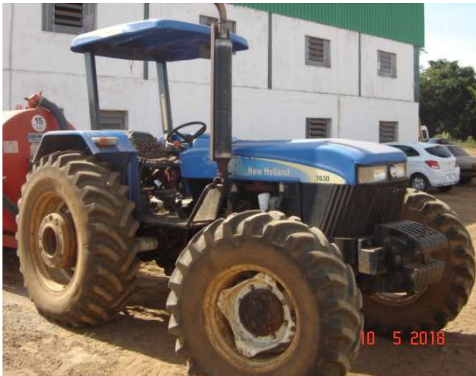
Vista parcial do trator agrícola